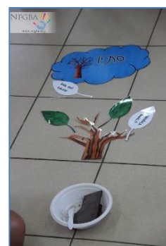
Aides aux devoirs, soutien scolaire personnalisé, apprentissage des mathématiques par ordinateur ...