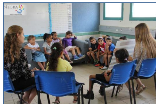
Jour de la rentrée dans les Maisons de l'Espérance