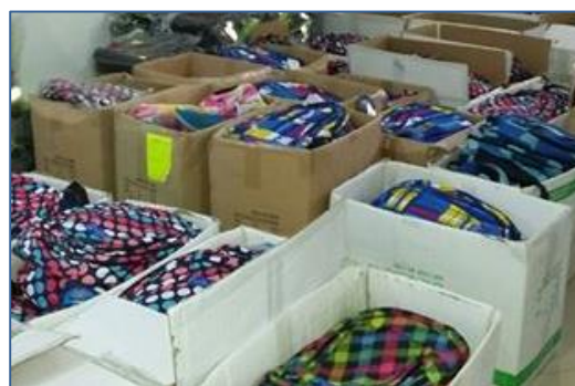
Près de 200 cartables garnis ont été offerts par l'Association Ezra Yehudit