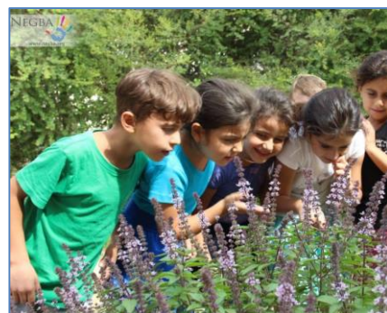
Reprise des activités sportives, culturelles, excursions, découverte de la nature ...